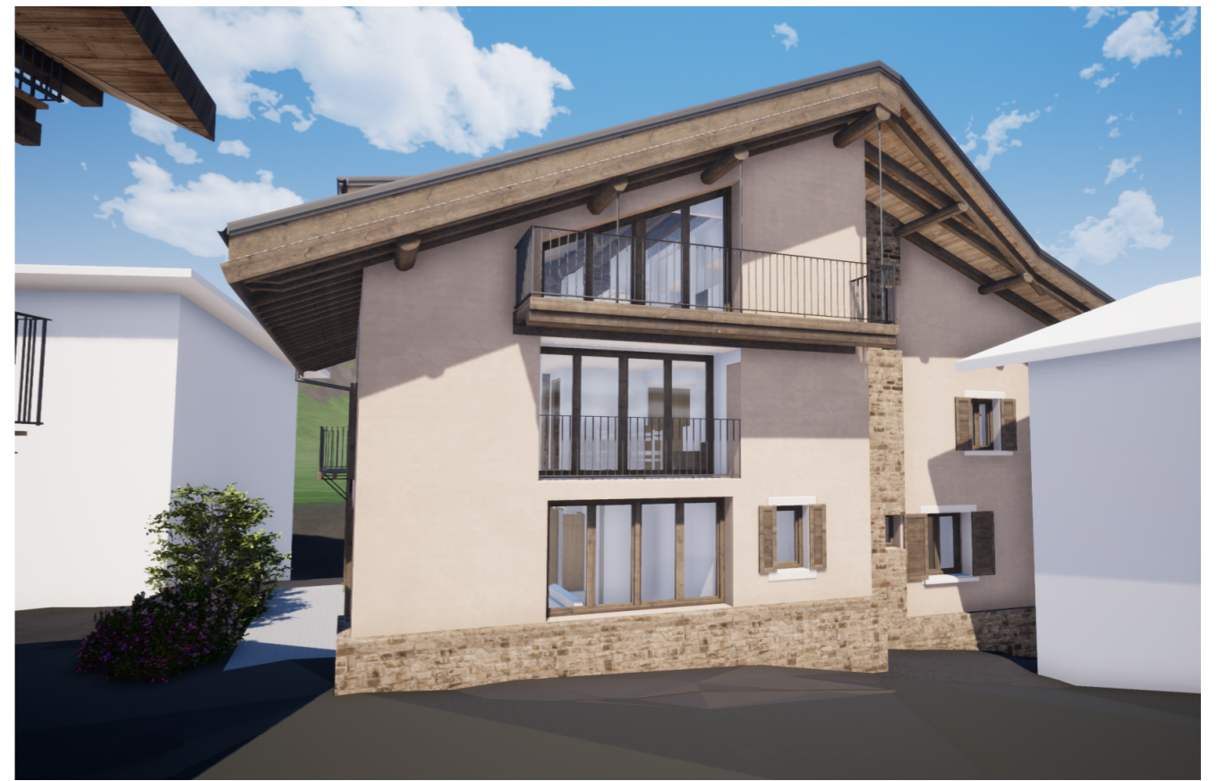
PH I Sud