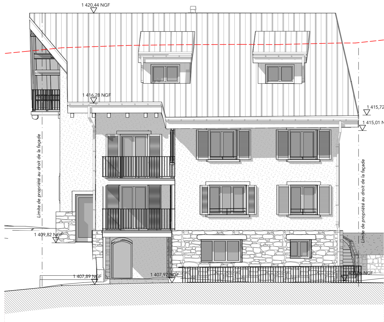
Façade Est Projet