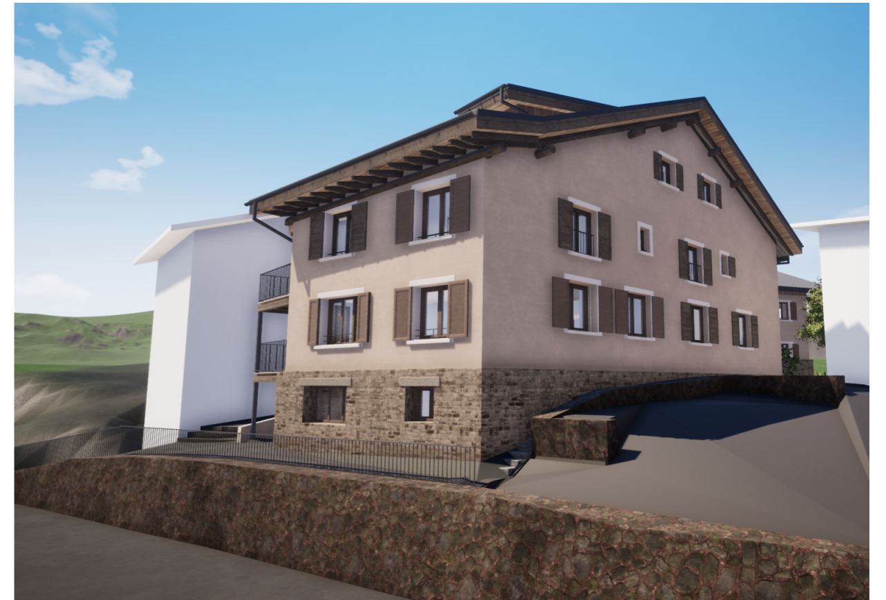
PH I Nord