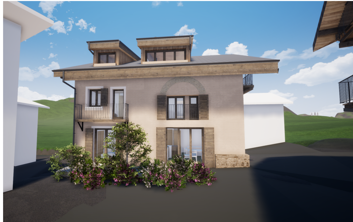
PH I Ouest