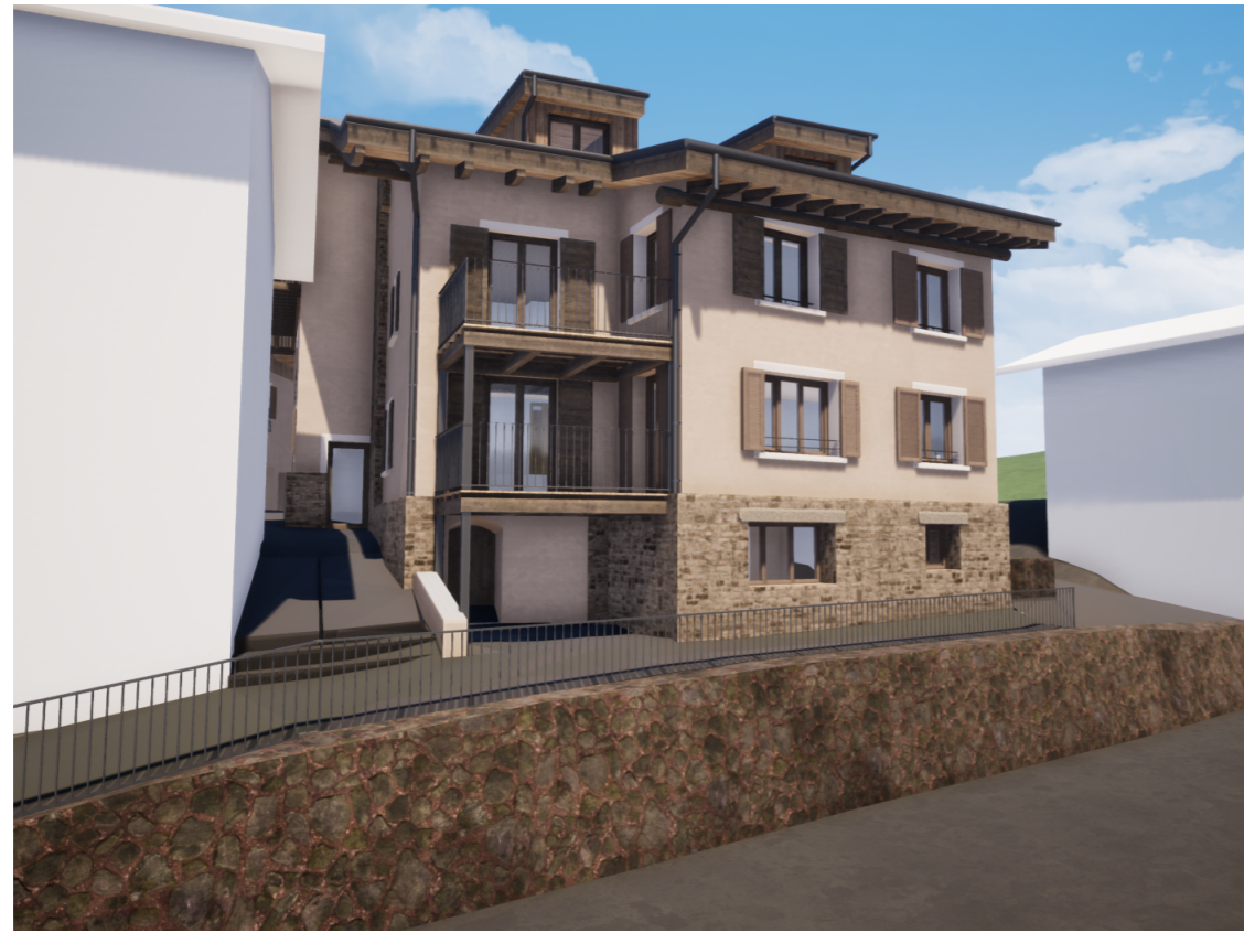
PH I Est