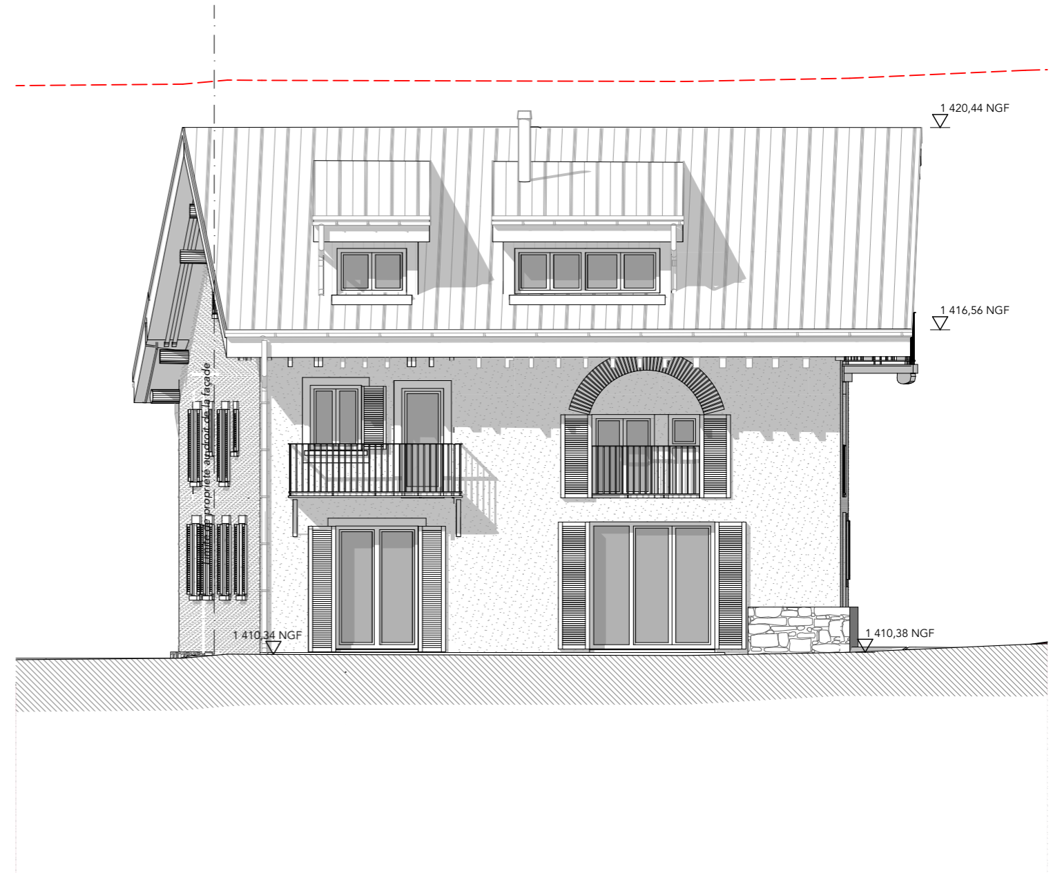
Façade Ouest Projet