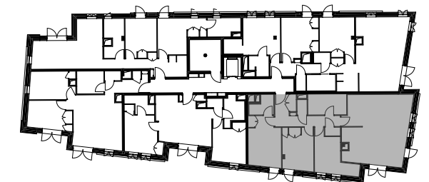
Plan de localisation