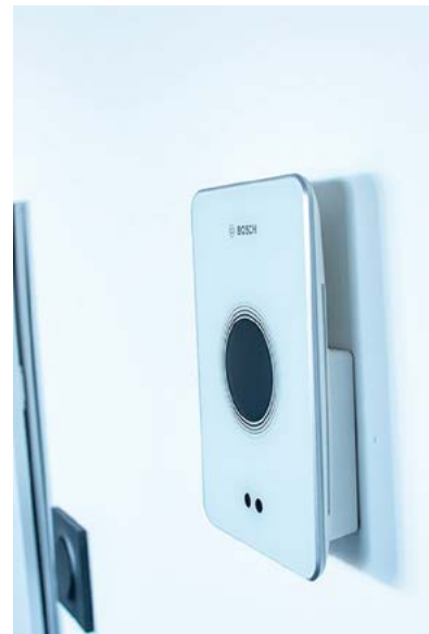
Domotique résidence MJ Développement L'Écrin - Arcs 1800 (73)