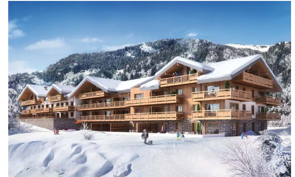
Les Terrasses de la Vanoise – Champagny-en-Vanoise (73)