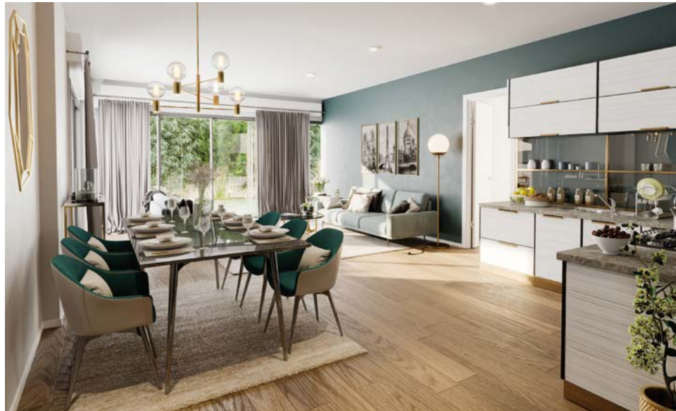
Domaine Naturé Seine – Cormeilles-en-Parisis (95)