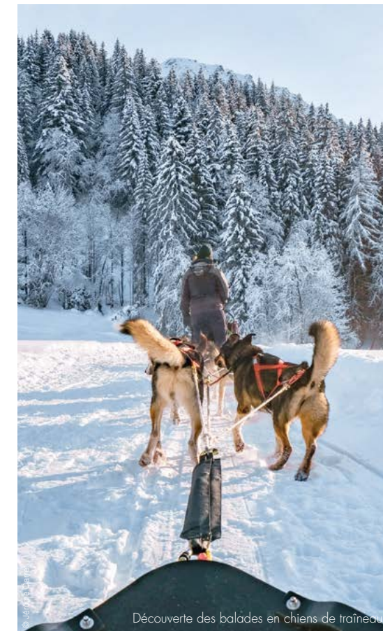
Découverte des balades en chiens de traîneau.