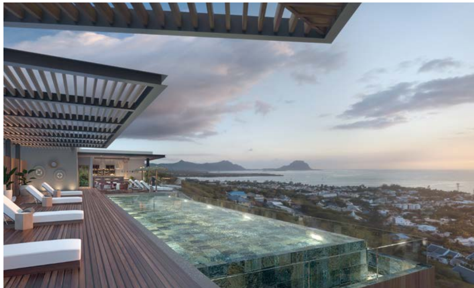
Resort Legend Hill – Rivière Noire, île Maurice