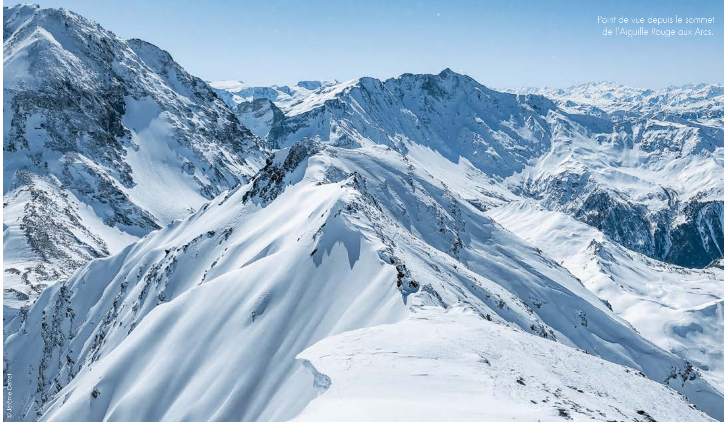
Point de vue depuis le sommet de l'Aiguille Rouge aux Arcs.