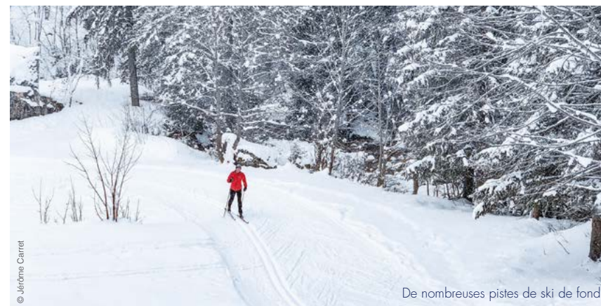
De nombreuses pistes de ski de fond.

Au-delà de ses 26 km de pistes balisées entre plateaux et forêts luxuriantes, le domaine attire les amateurs de ski nordique grâce à un site parmi les plus importants de Savoie. Pralognan-la-Vanoise possède aussi un site de ski de randonnée réputé pour la beauté de ses paysages. À ces activités de pure glisse s'ajoutent de multiples loisirs outdoor tels que les sorties en raquettes, le ski-joëring, la luge, la balade en calèche ou en compagnie de chiens de traîneau. Côté indoor , la station regorge d'équipements sport et bien-être (piscine, spa, patinoire, bowling, mur d'escalade, salle de sport...).