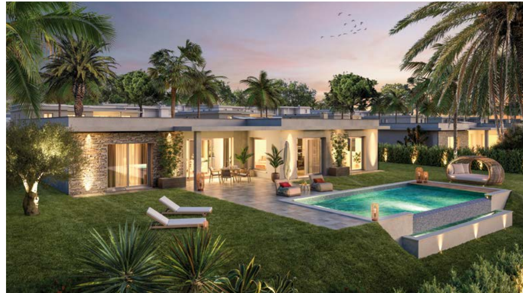
Quinta de Faro – Faro, Algarve, Portugal