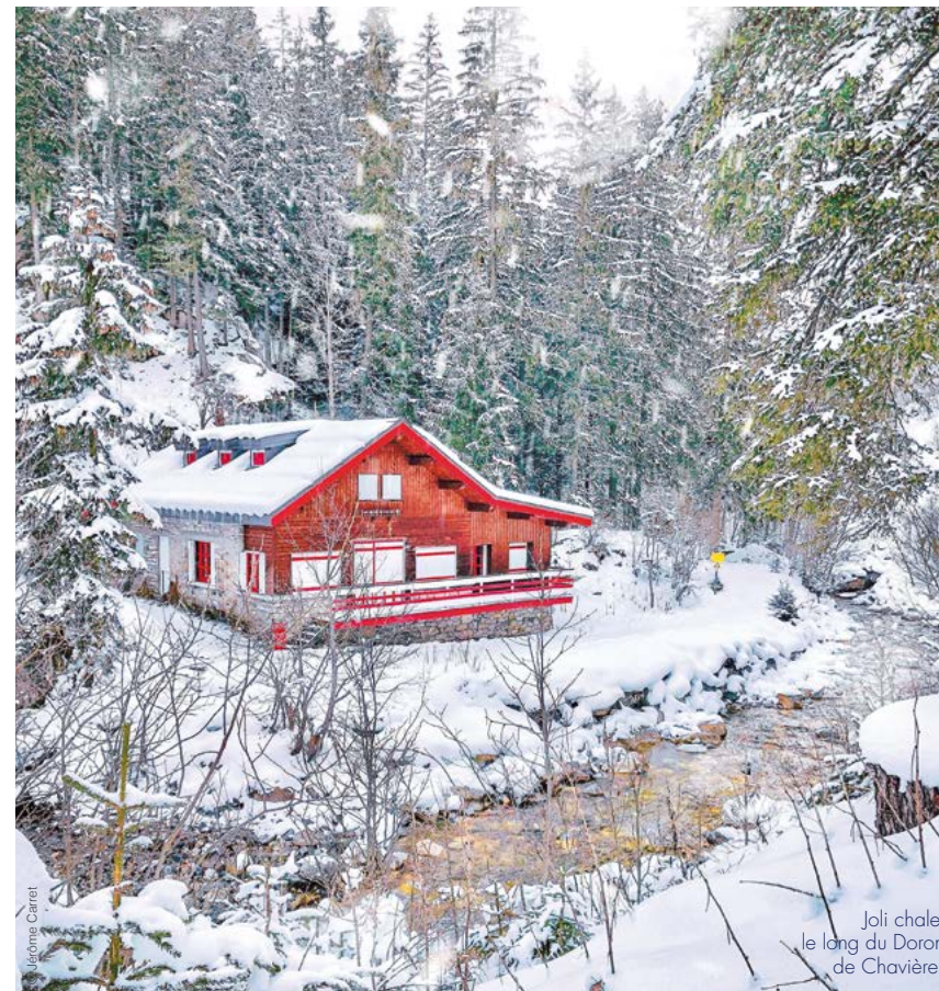
Joli chalet le long du Doron de Chavière.