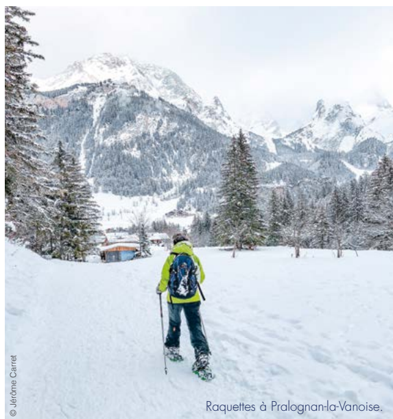
Raquettes à Pralognan-la-Vanoise.